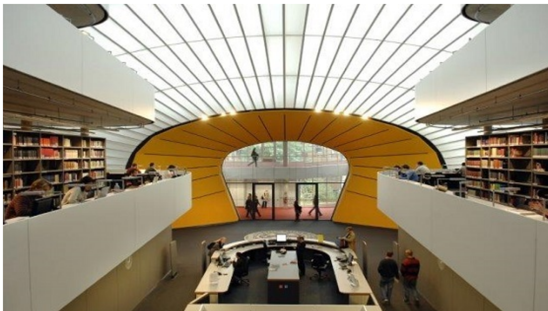
Le DAAD France en direct